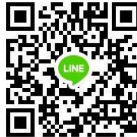
ภาษาต่างประเทศ