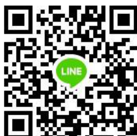
สุขศึกษาและพลศึกษา