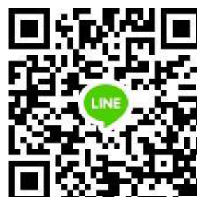
กิจกรรมพัฒนาผู้เรียน